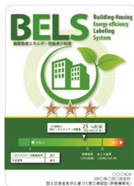
[図1] ガイドラインに基づく第三者認証の例

また、ダイヤモンドリスponsに対応した時間帯別・季節別の電気料金メニューが選択できる場合はその活用に努めるとともに、エネルギー管理システム（BEMS・HEMS等）の導入により、ビルの運用方法、住宅の住まい方の改善によるピーク対策及び省エネルギーに努めること。