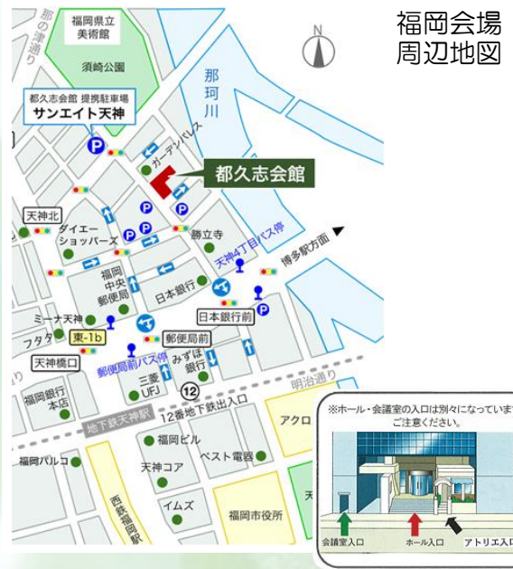
福岡会場 周辺地図