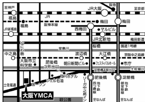
大阪会場周辺地図