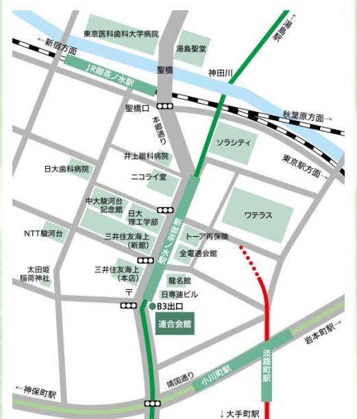
東京会場周辺地図